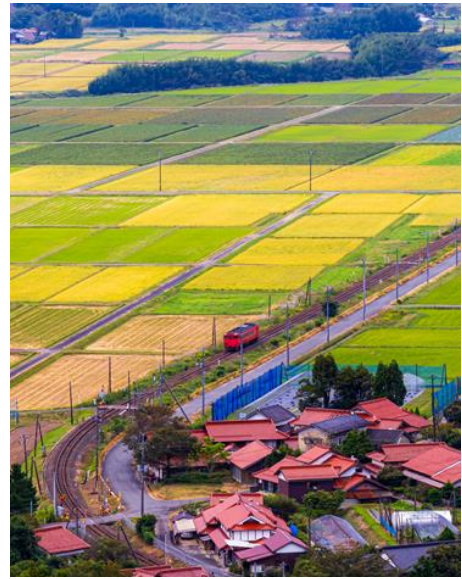
船平山展望台（山口市）