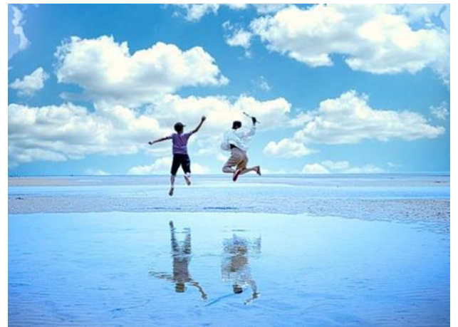
キワ・ラ・ビーチ (宇部市)