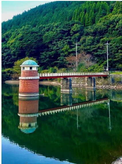
下関市水道局内日第一貯水池取水塔 (下関市)