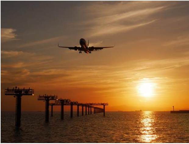
山口宇部空港（宇部市）