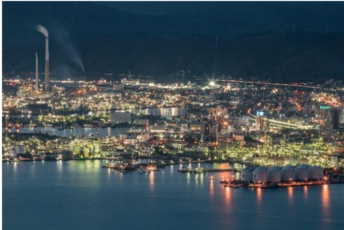
太華山の山頂（周南市）