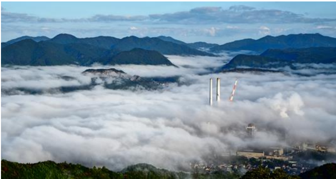
桜山総合公園展望台（美祢市）