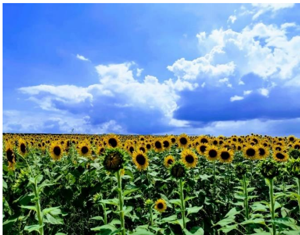
花の海 (山陽小野田市)