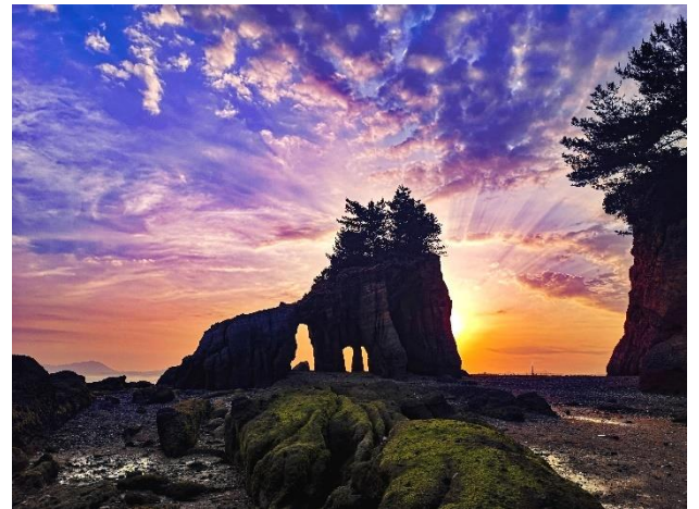
くぐり岩 (山陽小野田市)