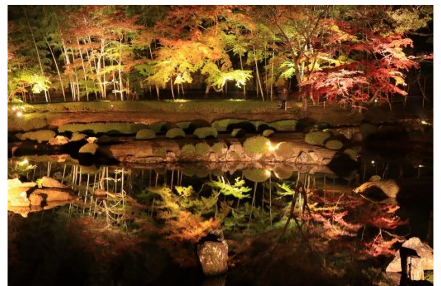
常栄寺雪舟庭（山口市）