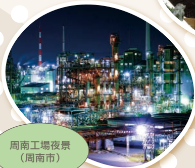
周南工場夜景 (周南市)