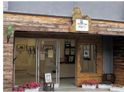
まちぐるみギャラリー