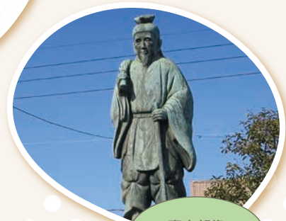
寝太郎像 (山陽小野田市)