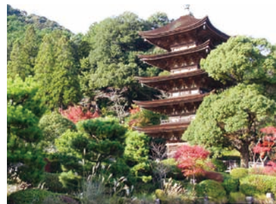
国宝瑠璃光寺五重塔