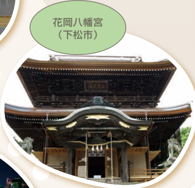
花岡八幡宮 (下松市)