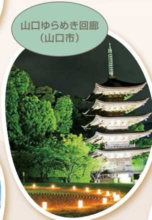
山口ゆらめき回廊 (山口市)