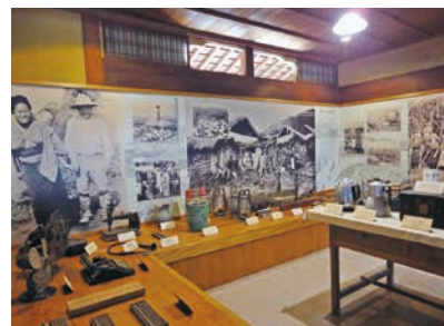
日本ハワイ移民資料館