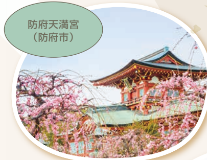
防府天満宮 (防府市)