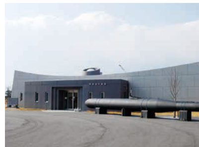
阿多田交流館と人間魚雷回天のレプリカ