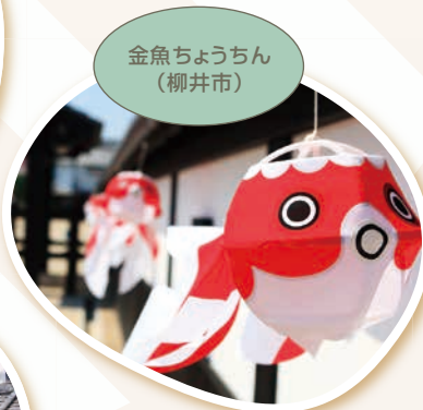
金魚ちょうちん (柳井市)