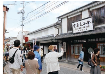
金子みすゞ記念館