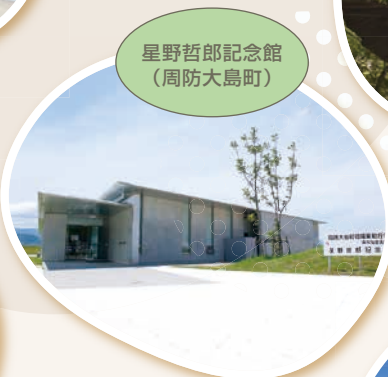
星野哲郎記念館 (周防大島町)