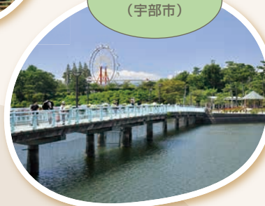
ときわ公園 (宇部市)