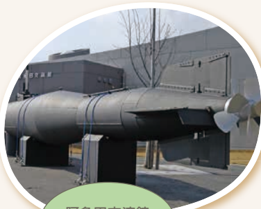
阿多田交流館 (平生町)