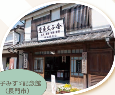
金子みすゞ記念館 (長門市)