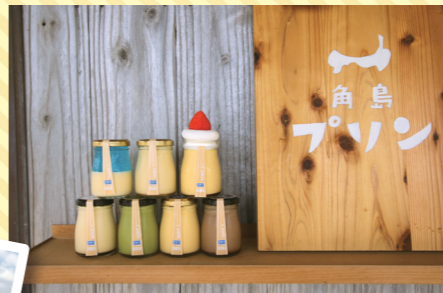
なめらかプリン¥465ほか

下関市豊北町大字神田3588-6 なし 🕒11:00~17:00(土日祝は~18:00予定) ※売り切れ次第終了 📍なし 📍あり