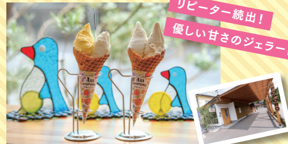
シングル¥520、ダブル¥590(コーンは+¥50)

秋田県産ジャージー牛乳をベースに、山口&宮城の食材を使用したこだわりのフレーバーを楽しめます。変わり種もお楽しみに!