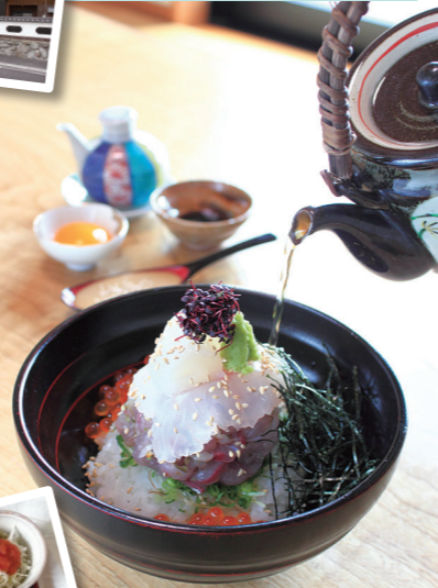
海鮮丼 ¥2,640 (汁物、茶碗蒸し、お漬物付) ※数量限定