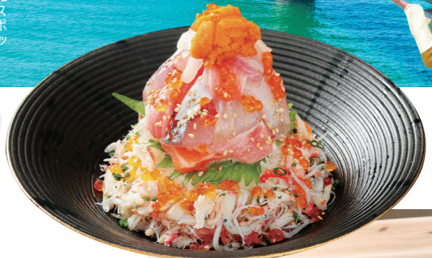
ぶっかけ贅沢海鮮丼 ¥2,530